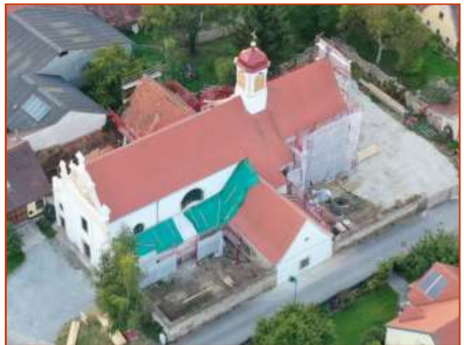
Oben: März 2021 - Unten: September 2021