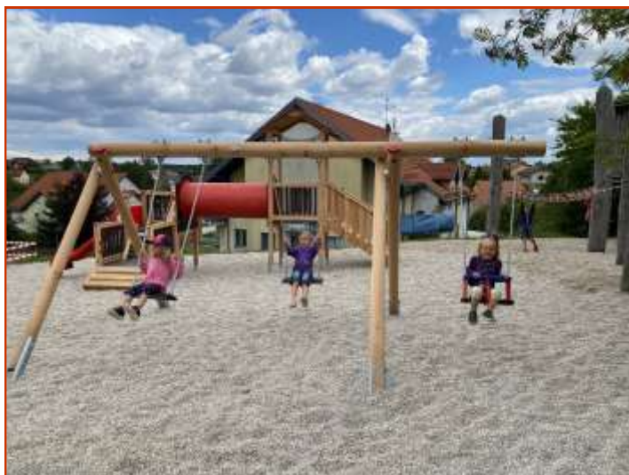
Generationenpark Echsenbach