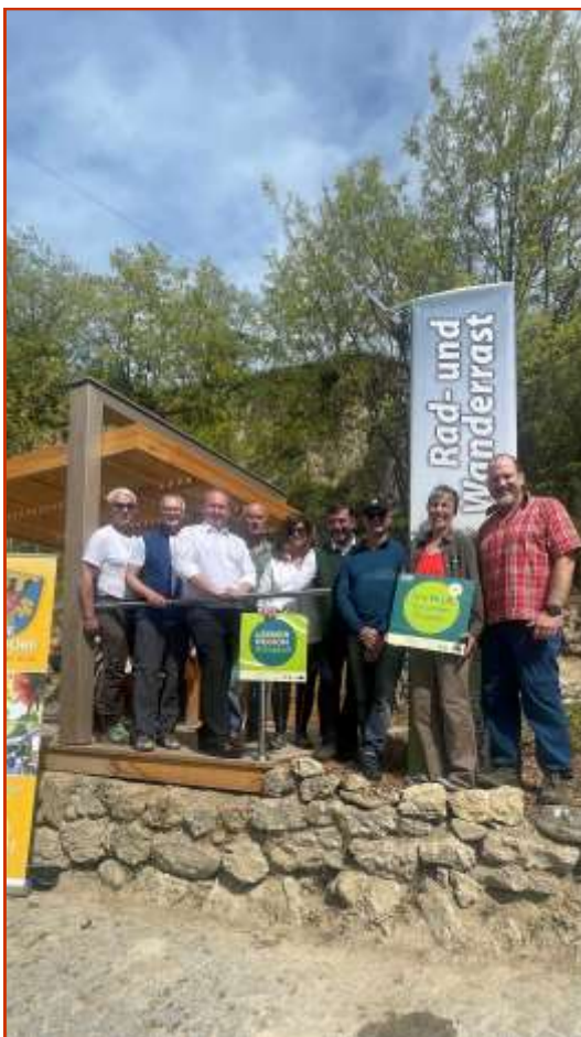
Eröffnung Radler-Rast-Rohrendorf