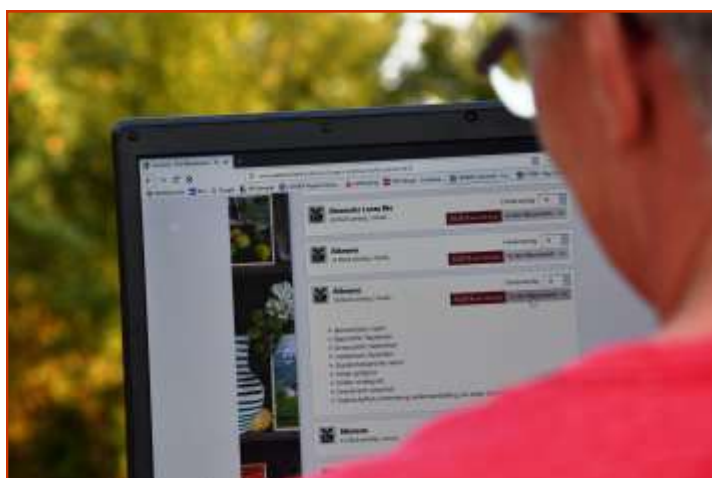
Obstbaumbestellung Symbolfoto

Mit Unterstützung von Bund, Land und Europäischer Union